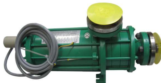
Насос Hermetic CAM 1/3