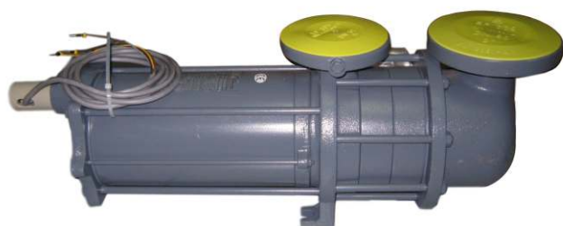
Насос Hermetic CAMR 2/3