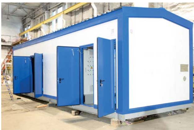
Внешний вид готового изделия

Блок-бокс представляет собой каркасно-панельное решение с размещенным внутри технологическим оборудованием, КИПиА и инженерными коммуникациями. Каркасом служат сварные стальные конструкции, а для стен и кровли применяются специальные сэндвич-панели.