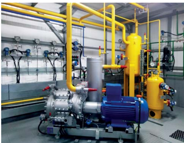
Вид готового изделия изнутри